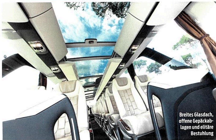
Breites Glasdach, offene Gepäckablagen und elitäre Bestuhlung