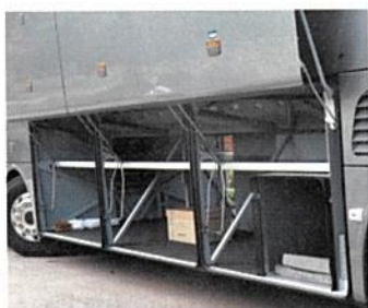
Gewaltiger Kofferraum mit horizontaler Trennung: oben die Taschen und unten die Koffer

Klare Schalterstruktur, die Bedienelemente sitzen dort, wo sie hingehören. Digitacho und Navi bleiben stetig im Blick, Schwachpunkte haben wir noch keine gefunden.