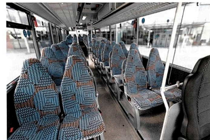
Reduziert auf wichtigste Komponenten: Die Ausstattung der UL business definieren Ausschreibungen der Auftraggeber.

Über den Setra UL business berichtete Askin Bulut.