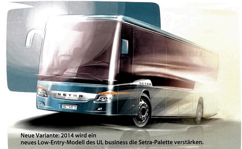
Neue Variante: 2014 wird ein neues Low-Entry-Modell des UL business die Setra-Palette verstärken.

Die zweiachsigen Überlandbusse sind serienmäßig mit dem Antiblockiersystem (ABS), der Antriebsschlupfregelung (ASR), dem Elektronischen Bremssystem (EBS)